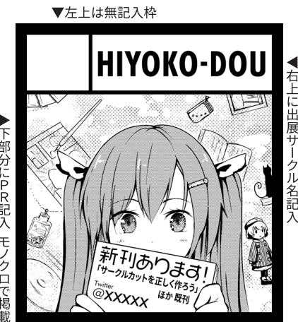
▼左上は無記入枠 ▼右に出展サークル名記入 ▼下部分にPR記入モノクロで掲載